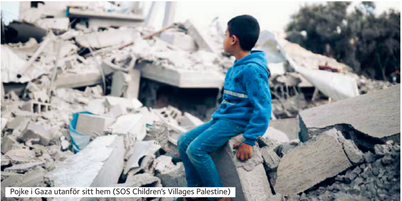
Pojke i Gaza utanför sitt hem

Påskens budskap lyder idag: "Inget mer krig i Gaza och ingen mer konflikt mellan det palestinska och det israeliska folket. Ingen mer fiendskap i Guds land."