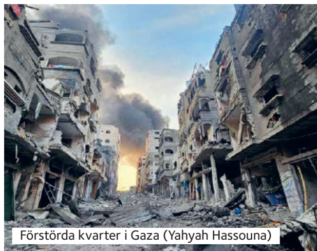
Förstörda kvarter i Gaza (Yahyah Hassouna)

Vi tackar Gud för vänner världen över som demonstrerar på gatorna, riskerar att bli arresterade för civil olydnad, outtröttligt uppvaktar sina valda politiker med krav på ett permanent eldupphör, fri införsel av humanitär hjälp till Gaza, ett slut på den israeliska ockupationen och palestinsk rätt till självbestämmande. Vi bönfaller er om att fortsätta detta arbete och era vittnesbörd.